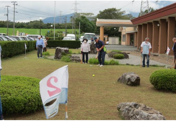
グラウンドゴルフに親しむ会は賑やかでした（昨年9月）

昨年度は新型コロナウイルスやインフルエンザの影響は感じさせながらも、北部コミセンに賑わいに戻ってきました。