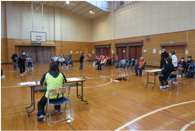
昨年度の大会風景

の「亀鶴会」の2老人クラブと「南一本木自治会」「いずみ菓子自治会」の4チームの参加が予定されています。和気あいあいとした熱戦が楽しみです。