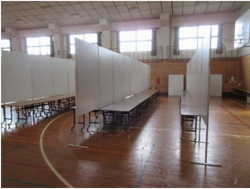
展示パネルは欠かせない

北部コミセン祭で使用する、展示パネルと支柱の借用申請を提出する。パネル32枚支柱41本、忘れてはいけないのが展示用フックだ。これがないと額などが