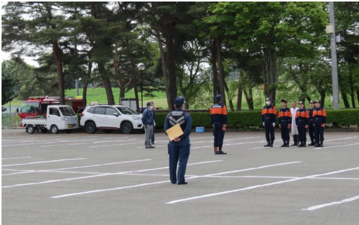
滝沢市消防団第6分団の規律訓練が、北部コミセンの駐車場を使って早朝など何度も行われている。地域のために活動する団員の皆さん、お疲れ様です。

滝沢市が誇る人気バンド「ウェンズデー」の練習日はバンド名の通り、水曜日。ギター、ト