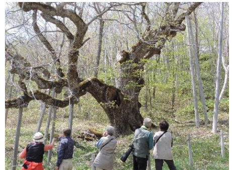
圧倒的な存在感で迫る

カタクリと巨木の撮影に大満足。峠の茶屋のアユ塩焼き、岩洞湖レストハウスの行者ニンニクを葉味にしたざる蕎麦と、ベのソフトクリームにも大満足。メダタシメダタシ。(塩田)