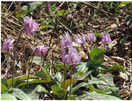
可憐なカタクリの花

先日、早朝に北部コミセンに集合し、車に分乗して出発。快晴。最高の天気だ。途中天峰山