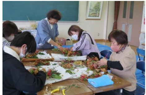
リースづくりの教室

「私も除雪やります」との彼女の一言。花巻での二日間の講習を終え、その二日後に駐車場に積もった雪。早速ホイローダーを操り、除雪デビューです。頼もしい。