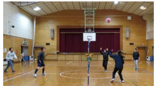
川前ソフトバレー

研修室は北部コミセンの自主事業・パッチワーク教室が毎週木曜日に開かれ、作品づくりに取り組んでいます。真剣にそして賑やかに。