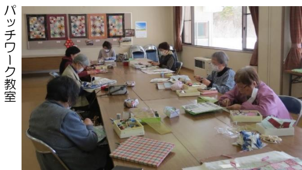
パッチワーク教室

談話室は、週2回やってくる花みずき会が、毎回演歌を流して日本舞踊の稽古です。時々大集会室のステージも使います。