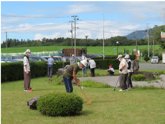
昨年の大会の様子

避けるなどの対策をとって開催します。ワイワイと楽しみながらプレーしましょう。コミセン周辺の特設コー