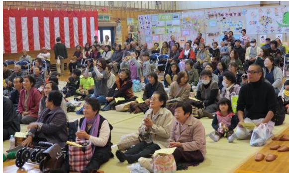
楽しんでいただきたい

ップバッターを務めてきた生バンド・ウエンズデイと連絡を取った。開会式までには、楽器や音響の仕込みを終えている必要があるからだ。「大丈夫ですよ。やりますから」との返答。ありがたい。