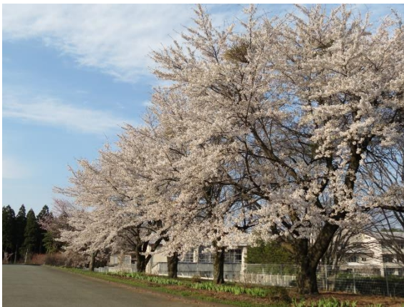
今年も、北部コミセンの桜が見事に咲き利用者の目を楽ませてくださいました。

時には3人がロビーで待っているといった大渋滞も発生した。記憶では30分以上ロビーで待った人がいたことも。北の湯にやってくるタイミングによることなので、こればかりは調整のしようがないのだ。逆に「今日は一人も待った人がいなかったね」という日もあった。