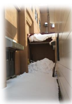
大集会室と 北の湯の間