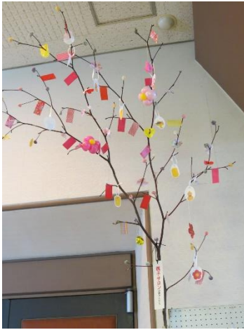
市社会福祉協議会の親子サロンで作製したみずき団子もロビーを彩っています。

そしてパッチワーク教室の皆さんによる、たくさんのおつるし雛が目を楽しませてくれます。雛一つ一つがかわいらしく癒されます。どうぞ北部コミセンのロビーにお立ち寄りください。