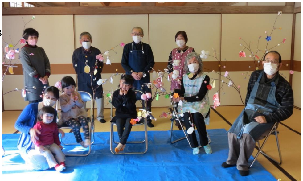
1月18日(火)の「親子サロン チャチャチャ」は、「みずき園子」のりでした。北部コミセンのロビーにもいただきました。 ※今後、コロナ感染防止のために、中止になることがありますので滝沢市社会福祉協議会(684-1110)にご連絡ください。

混雑した場所や感染リスクの高い場所への外出の自粛、まん延防止等重点措置区域への不要不急の移動の自粛、家庭や職場を含むすべての場における基本的な感染対策を徹底をほかりコロナ禍を乗り切りましょう。