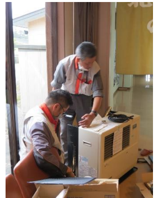
ロビーのストーブ新しく

今年度の修繕はひと段落だが、来年度以降も計画的に迅速に取り組んでいきたい。(塩田)