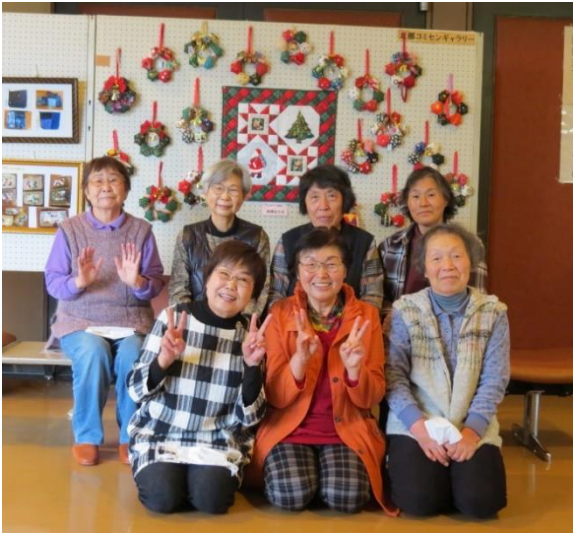
自主事業パッチワーク教室の皆さん

色とりどりのリースや、サンタクロースも織り込まれたタペストリーがロビーを華やかに彩っています。