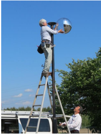
外灯の水銀灯取替は業者さんをお願いした

6月に入り玄関前の円形花壇に立つ外灯が点灯しない事態が。5本の外灯の中でも一番大事な場所である。機器の不具合だともう部品が手に入らないので新たにLED化するしかないかと覚悟したが、幸いに機器は正常で水銀灯