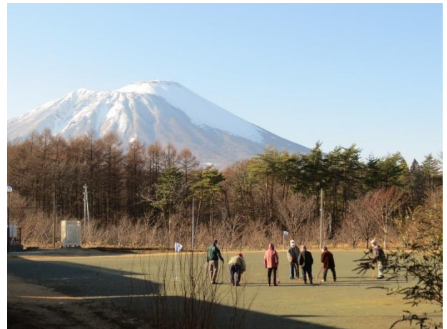
暖房が効いた大集会室でプレーするつもりでしたので、薄着でちょっと寒かったが気分は爽快。