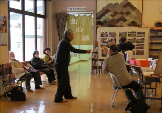
入浴後は近況報告なども

この間、静まり返っていたロビーは、再開当日北の湯利用者の笑顔と笑い声に包まれました。「久しぶりです！今年もよろしくお願います」。年が明けて初めての顔合わせで、新年の挨拶も聞こえてきます。