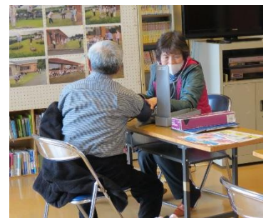
久しぶりの健康相談

コロナ対策で入浴前後のマスク着用や、検温、人数制限など制約はありますが、北部コミセンの魅力の一つである北の湯に日常が戻ってきました。