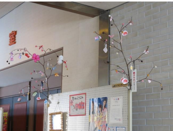
今年もみずき団子をいただきました

参加者、ボランティアを合わせて150名ほどが大集会室に集い、卓球と輪投げ競技で腕を競い、その後全員で昼食をとりながら交流する企画