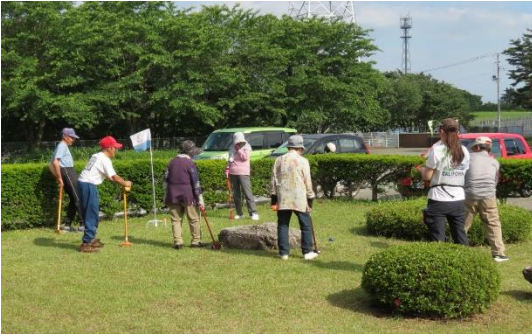
気持ちよくプレーする亀鶴会の皆さん

大集会室では一般の方々がバスケットボールやバドミントンを楽しむ姿が連日のように見られます。また一本木中学校バレーボール部が定期的に練習をしているほか、一本木バレーボールスポーツ少年団の元気な子供たちの声が響きわたっています。