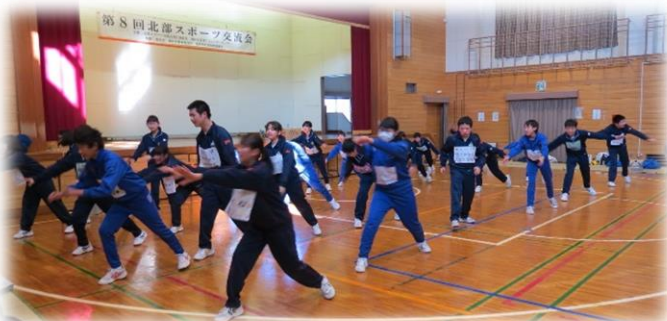
交流会のフィナーレは中学生たちの群舞で

参加者の感想 ・卓球をやってみんな強くてビックリした。 ・今年卒業なので最後の参加だけでも3勝できてよかった。 ・カレーがとても美味しかった。 ・皆さん一所懸命でこちらも若返った気がします。(ボランティア)