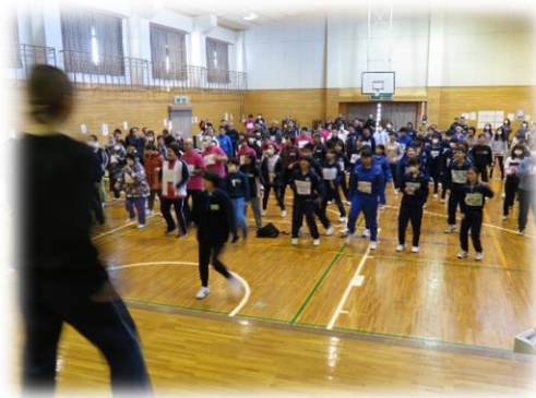
盛大短期大学部生のリードで準備体操