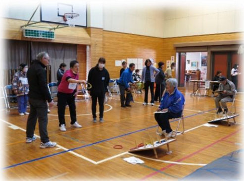
輪投げは63名が腕を競いました