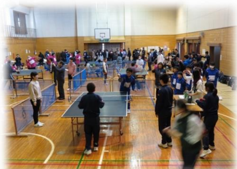
応援にも熱がこもった卓球