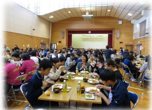
みのりホーム特製カレーライスは大人気