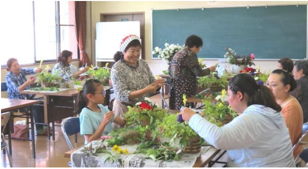
昨年のフラワーアレンジメント教室

各自主事業の詳細については北部コミセン通信で随時お伝えします。地域の皆さんのご参加・ご協力をよろしくお願いいたします。