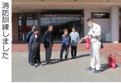
消防訓練しました

50人ほどの子供たちは上映中、笑い声や歓声をあげて楽しんでた。なかでも漫画家ちばてつや原作の「風のように」は素晴らしい作品で子供たちはもちろん、私自身が引き込まれてしまった。映画っていいですね。(塩田)