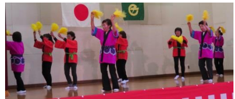
一本木婦人会・J A女性部