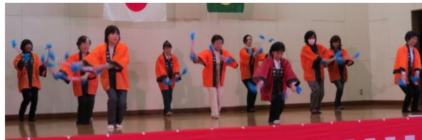
柳沢自治会婦人部