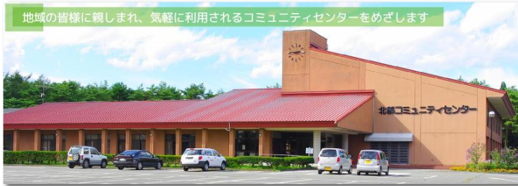
地域の皆様に親しまれ、気軽に利用されるコミュニティセンターをめざします

暖かくなる7月には屋外でのグラウンドゴルフ大会と、村内の福祉施設等に呼びかけて北部スポーツ交流会で参加者の親睦と交流を図る予定です。