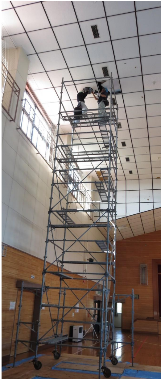
足場を組上げての作業でした