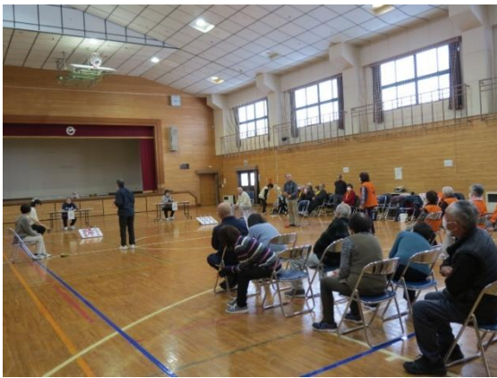
昨年度の大会風景