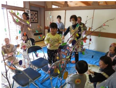
みずき回子づくり(1月)

継続する中で新しく参加する親子も増えてきて、北部地区にも親子サロンが浸透してきているようです。ぜひ気軽に遊びに来てください。