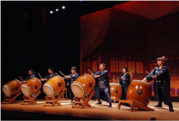
蒼前太鼓（蒼前太鼓保存会）

もちろん一本木・柳沢両保育園のお遊戯や、みのりホームのダンス、ウエンスデイのバンド